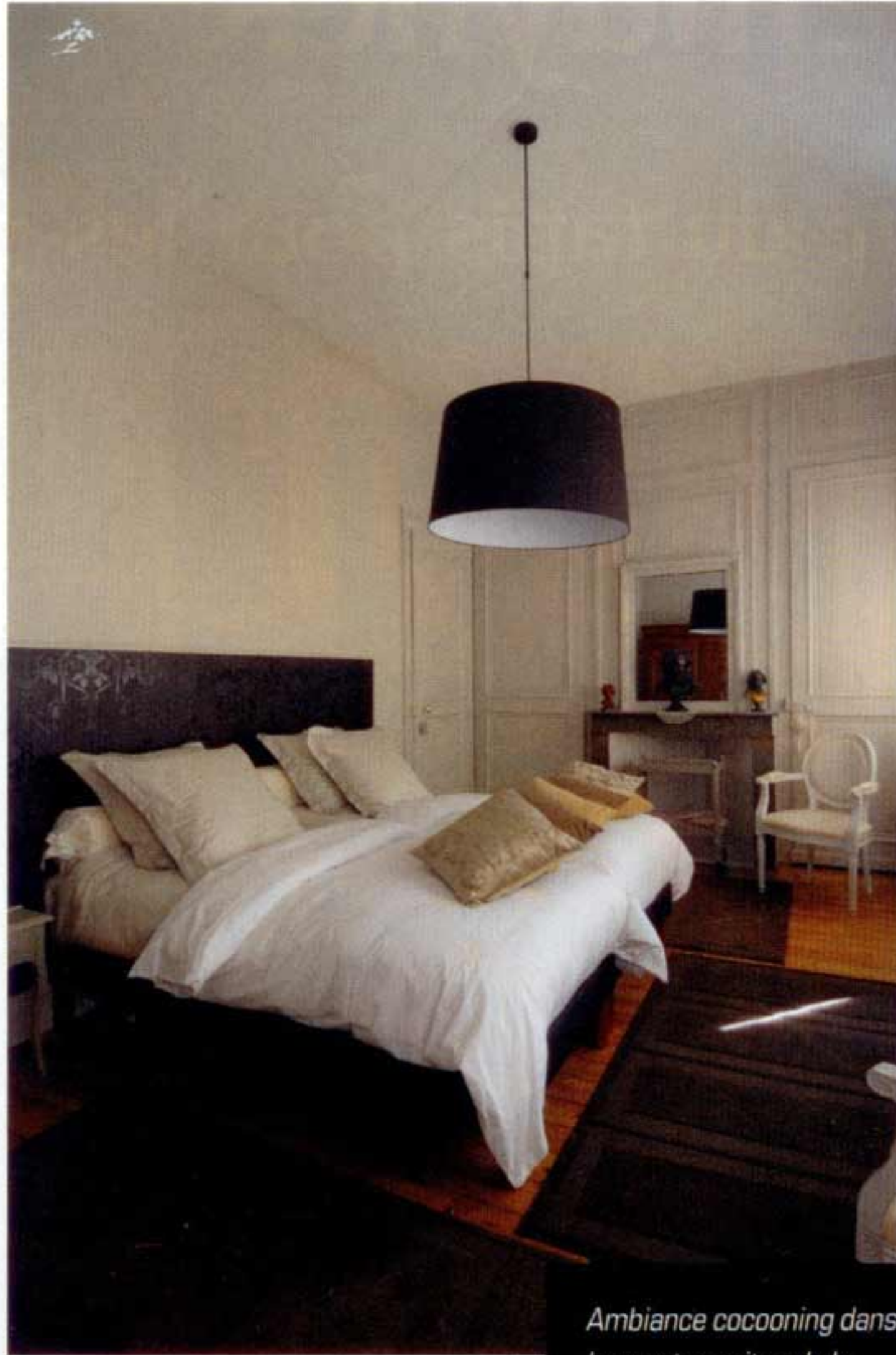
Ambiance cocooning dans les quatre suites de la Maison du Champlain.